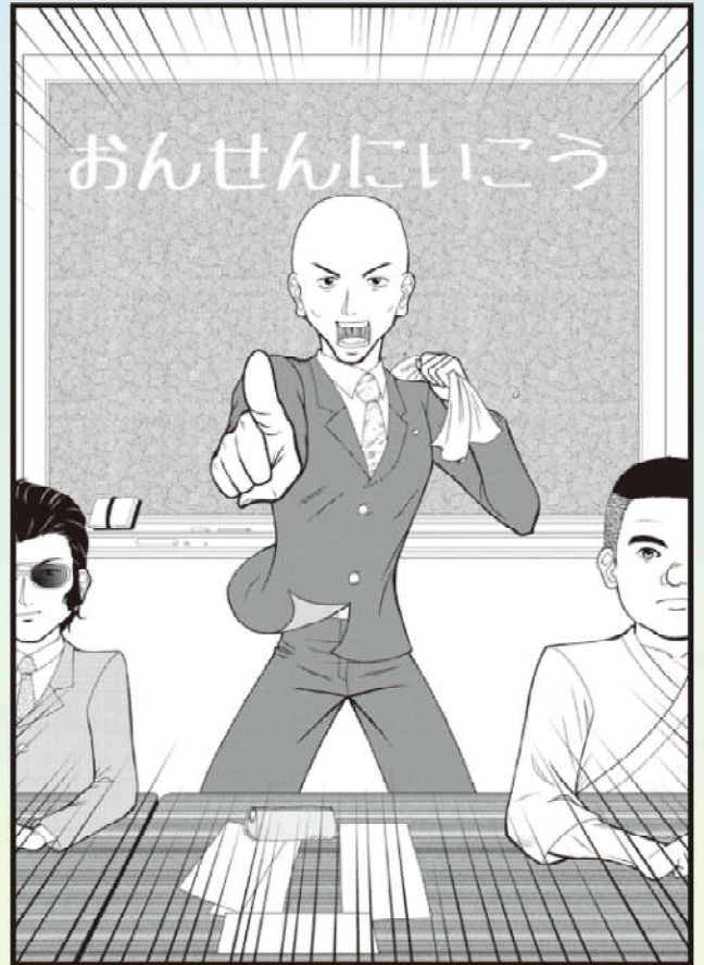
作/さいじょうまんが屋