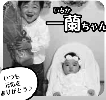
いちか 一蘭ちゃん