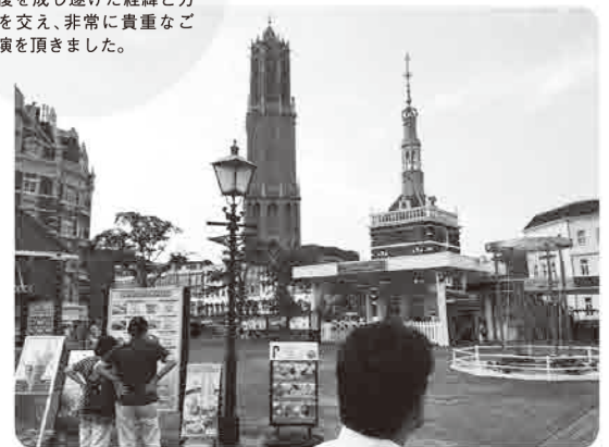
▲異国情緒溢れる園内。常に多くの観光客が往来していた。

◀二度の経営危機からV字回復を成し遂げた経緯と方針を交え、非常に貴重なご講演を頂きました。