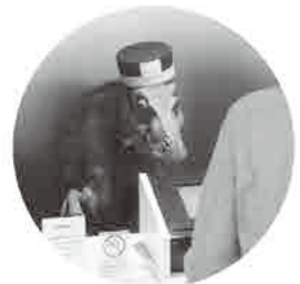
▲やたらとテンションの高いロボットスタッフ[きぼう]さん。