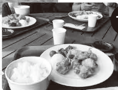
▶ 別府湾SAにて自由昼食。写真はとり天定食。