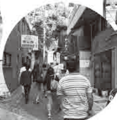
▲路地もいっい雰囲気。