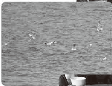
◀ 三崎港よりしぼしの船旅。じゃこ天旨し!