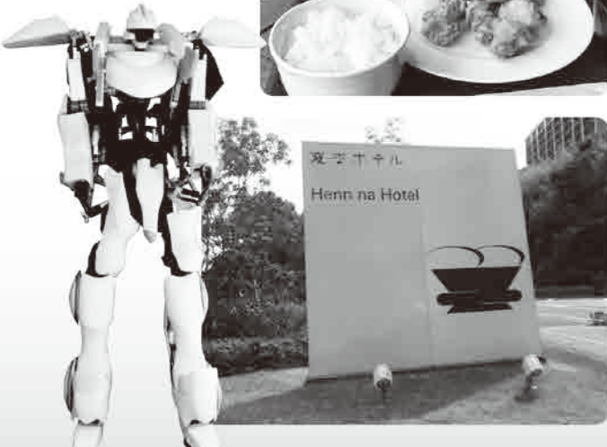
▼ 変なホテル到着。どう見ても戦闘用のロボがお出迎え。