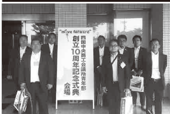
6.3 四国中央YEG創立10周年記念