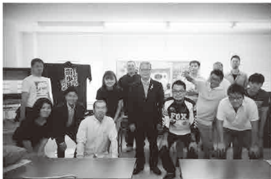
6.17-18 視察研修【四ヶ町商店街】にて