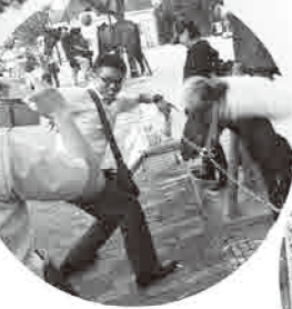
▲園内散策でテンションアップ! ◀懇親会はハウステンボス内の「花の家」にて。