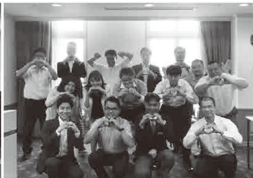
6.17-18 視察研修【ハウステンボス】にて