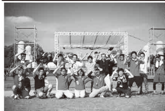
7.23 STONE HAMMER fes.2017にて