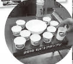
▲GCIグランプリで使用する容器。投票はスプーンで行われる。