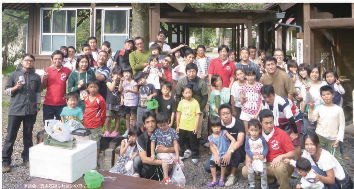
家族会 / 西条石緑ふれあいの里にて