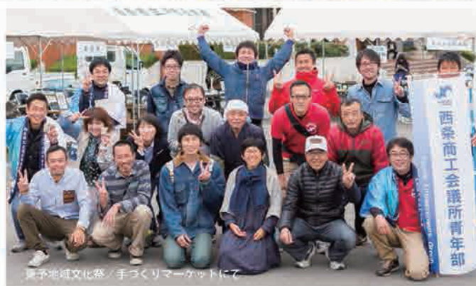
夏子地域文化祭 / 手づくりマーケットにて