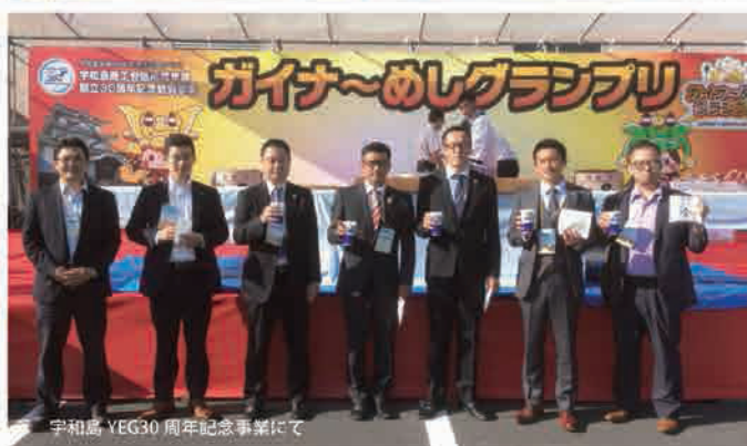
宇和島 YEG30周年記念事業にて