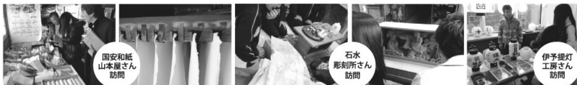
国安和紙山本屋さん訪問